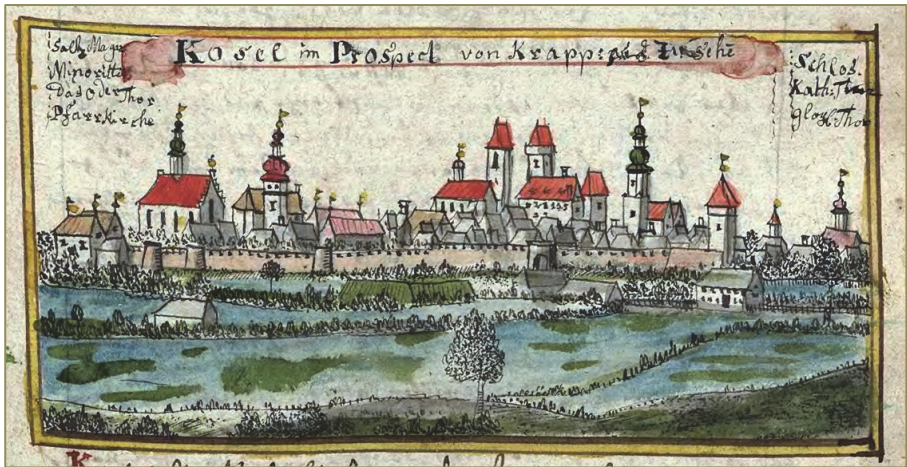
Abb. 1: Cosel im 18. Jahrhundert. Friedrich Bernhard Wernher: http://upload.wikimedia.org/wikipedia/commons/2/25/Cosel.jpg