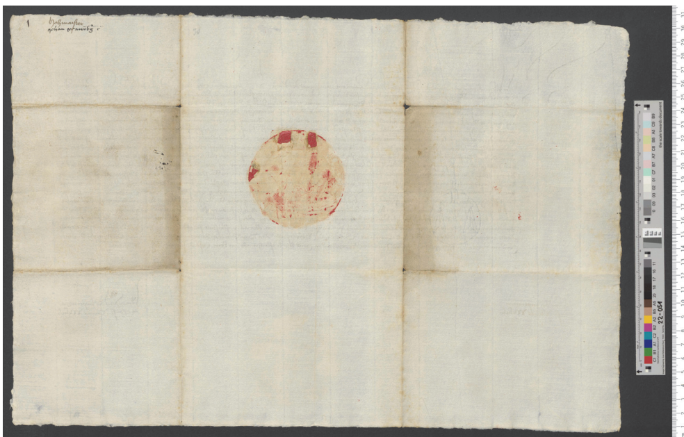
Vorder- und Rückseite der Urkunde GSTA PK, XX. HA, OBA, Nr. 11842.